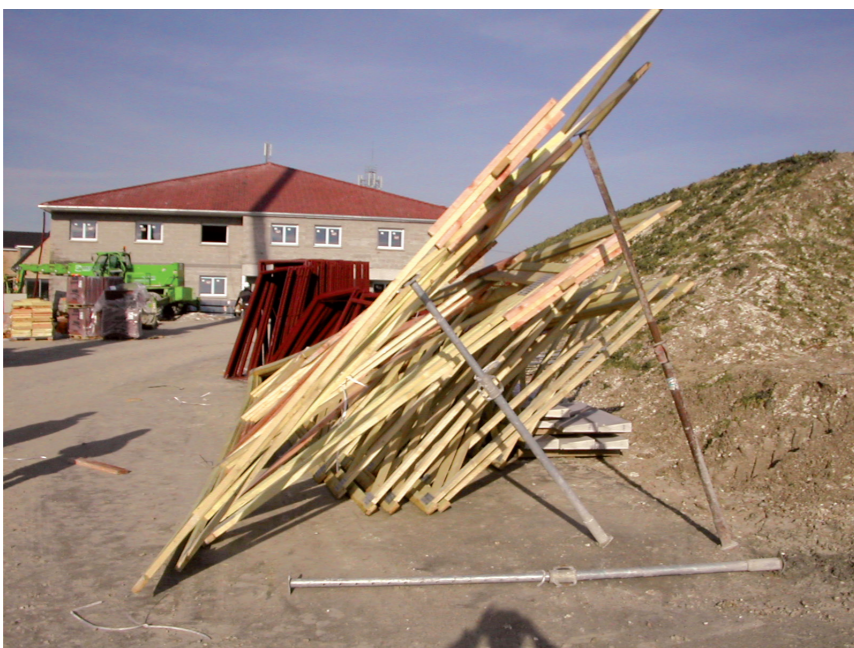
1 Pièce en bois maintenant la structure interne de la fermette